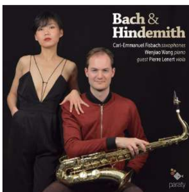
Bach & Hindemith Label Paraty, PIAS Harmonia Mundi, 2019